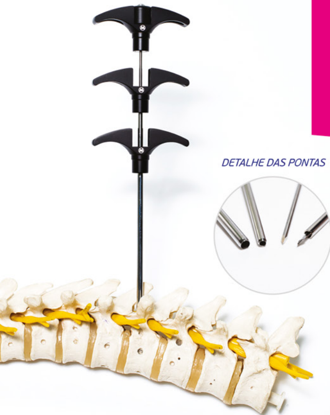
DETALHE DAS PONTAS