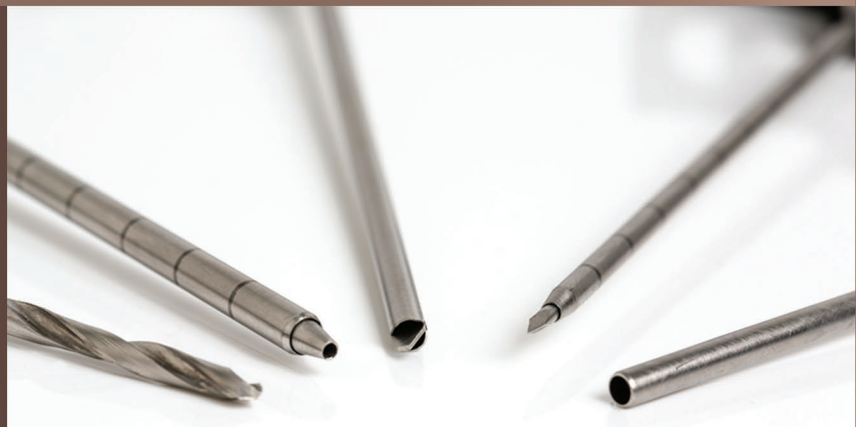
Detalhe das pontas