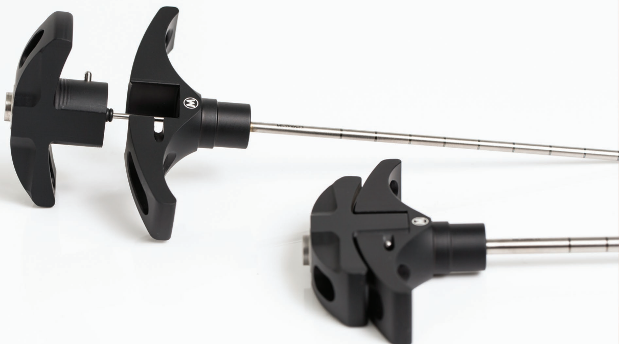
Conjunto estéril/descartável - uso único