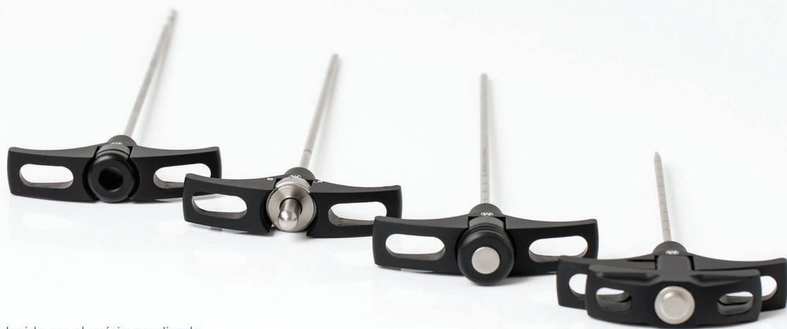
Produzido em alumínio anodizado