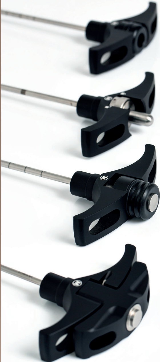
Acabamento em alumínio anodizado

Uma técnica simples e intuitiva aliada a equipamentos confiáveis e precisos resulta em um procedimento minimamente invasivo, rápido e eficiente.