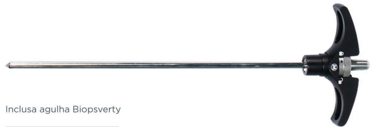
Inclusa agulha Biopsy