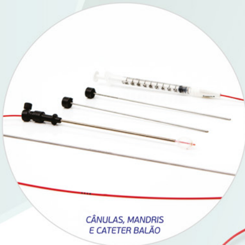
CÂNULAS, MANDRIS E CATETER BALÃO